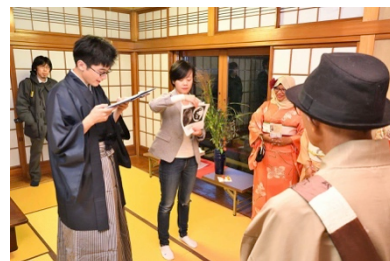
昨年度活動当日の様子(左は参加学生)

昨年度の連携科目は、学生による学習コンシェルジュの自発利用を促すために試みました。今年度では連携の仕方を改善し、前期においては「図書館情報学概論」と連携し、提出されたレポートに対して担当教員がフィルターをかけた上、学習コンシェルジュにて指導を受ける仕方を取っています。また後期においても継続実施する予定です。