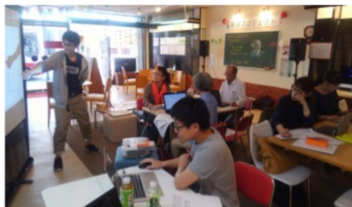
受講生のPCに課題が含まれたエクセルシートを入れて、一緒に課題を解いていきます。