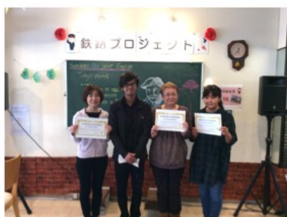
卒業証書を持って “ハイチーズ！”