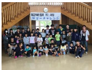
■やる気満々の小学生

●豊富町の小学生・中学生を対象とした学習支援も3年目(夏冬で5回目)を迎えました。今年は、2年生以上の学生14名全員、教員4名が参加し、充実した学習支援ができました●夜遅くまでかかった事前準備、一人ひとりに対応した教材研究は夜中まで。実践的な力をつけました●「わかりやすい」「わかった!」の声、そんな苦労も吹き飛ばしてくれます。子どもたちも学生も楽しかった『学び』の貴重な体験でした。