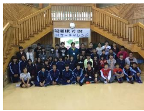
■人数が増えた中学生